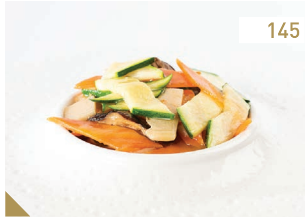
Verdure miste saltate