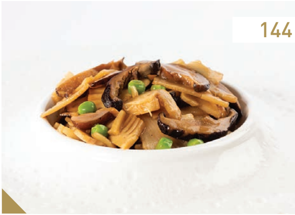
Funghi e bambù saltati